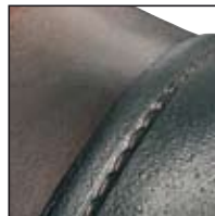
GÜK mit versenkten Nähten