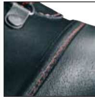
GÜK mit versenkten Nähten